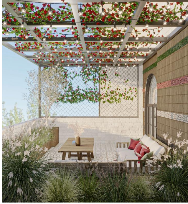
الشكل رقم (١٦) الشرفة الخارجية المصدر: تصميم الباحثة (November) نموذج تطبيقي على برنامج 3DMAX