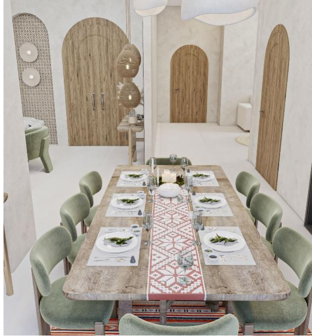
شكل رقم (١٣) منطقة السفرة

كما يظهر في الشكل رقم (١٣) السفرة المصنوعة من خشب الزيتون دمج عن طريق الحفر التطريز فيها عن طريقة مربعات واستخدام نجمة كنعان الاكثر انتشارا بين اشكال التطريز على خلفية حمراء لتعزيز فكرة الوان العلم الفلسطيني.