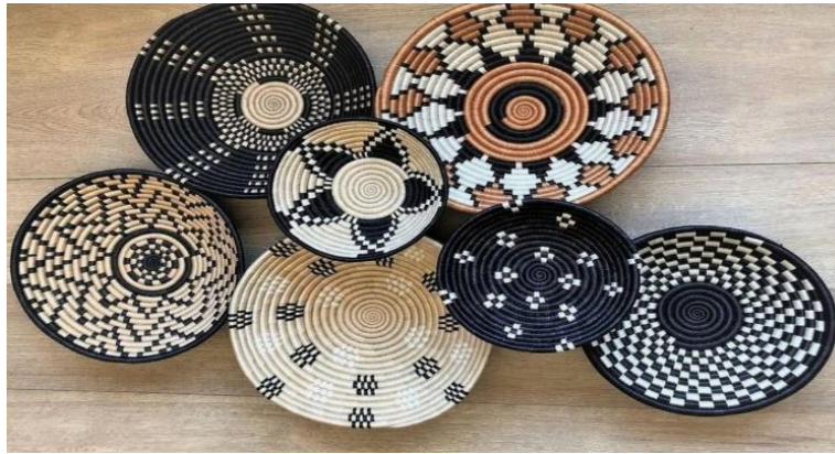
الشكل (٢) نموذج صواني القش.