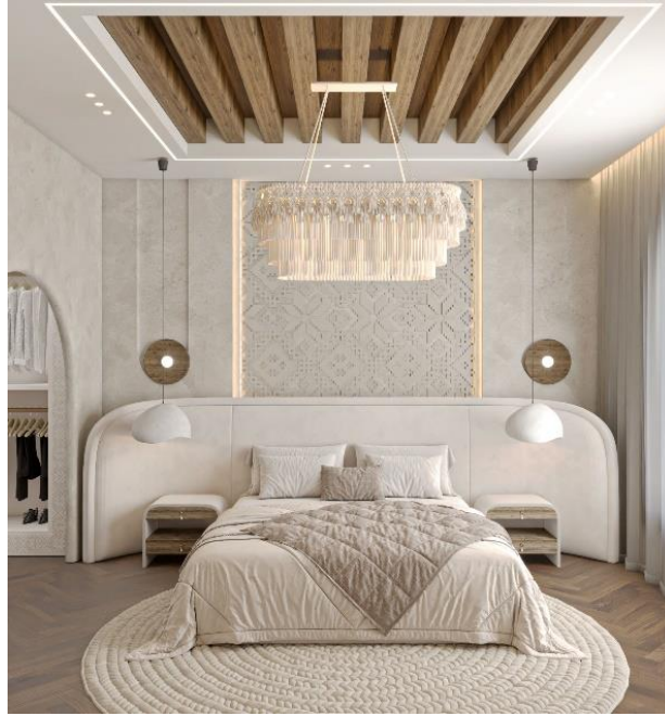
شكل (١٧) غرفة النوم الرئيسية. (November) نموذج تطبيقي على برنامج 3DMAX

نرى أن اللون البيج يطغى على كافة الغرفة و سبب استخدامه لانه لون مريح للعين ويبعث على الراحة و ذو طابع راقى وهادئ و مناسب مع تصميم غرفة النوم, و بروز التطريز في جدار السرير في شكل نجمة كنعان كما في الشكل رقم (١٧)، والثريا على شكل المكرومية في ذات اللون البيج انها كانت تصنع بشكل يدوي في فلسطين في طابع الحدائثة.