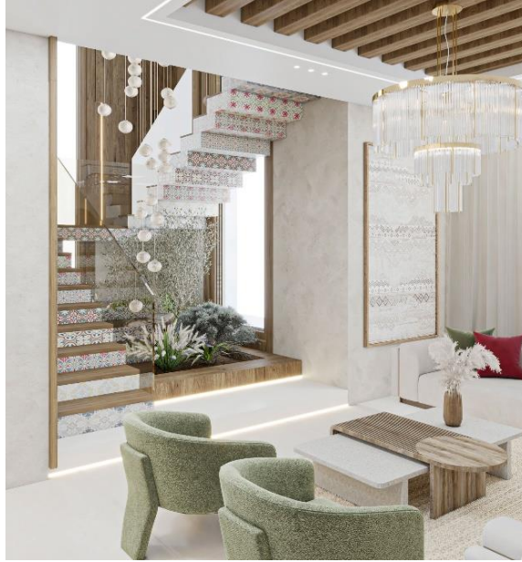
شكل رقم (١٠) غرفة الاستقبال ومنطقة الدرج

كما يظهر في الشكل رقم (١٠) وبلاط الموزييك المصنوع في نابلس يدوياً القادم البينا قديماً من دمشق من خلال التجارة وبعد بالأصل فرنسياً المستخدم في منطقة الدرج في صورة حديثة تم ادخاله مع خشب البلوط حيث ان العلاقة بينهم جميلة ومتوافقة ودمج شجرة الزيتون أسفل الدرج لتعزيز محددات الهوية الثقافية الفلسطينية .