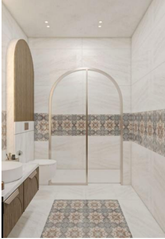
شكل (٢١) الحمام

تم استخدام خشب البلوط و بلاط الموزيك والاقواس العثمانية و الرخام الفخم و إضافة لمسة ذهبية للفخامة و الرقي و لأبراز التصميم و إضافة طابع مشرق كما في الشكل رقم (٢٠،٢١) .