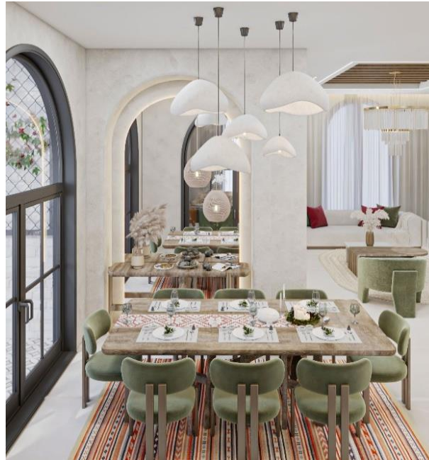
شكل (١٢) منطقة السفرة

كما يظهر القنصل المصنوع من خشب الزيتون ايضاً حيث يظهر جمالية وفخامة القنصل, والثريات الحديثة على شاكلة الفخار كما في الشكل رقم (١٢).