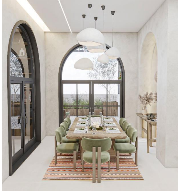
شكل (١١) منطقة السفرة

المصدر: تصميم الباحثة (November) نموذج تطبيقي على برنامج 3DMAX