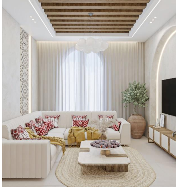
شكل (٧) غرفة معيشة

كما يظهر في الشكل رقم (٧) تم استخدام لون البيج بشكل أساسي للجدران والسقف والبلاط والاثاث مماعطى شعورا بالهدوء والبساطة الملمتة، ودمج القش من خلال السجاد المصنوع يدوياً من قش القمح في صورة تتجلى بين الحداثة والتراث وأضفاء طابع من العراقة والاصالة والتشبت بالجنور من خلال ادخال شجرة الزيتون داخل الفخار المصنوع يدوياً و عززت هذه العلاقة الجميلة التعبير عن محددات الهوية الثقافية، و استخدام خشب البلوط المنتشر في البيئة الفلسطينية في المزنون والسقف والابواب، وخشب الزيتون في قاعدة طاولة الوسط كما أن العلاقة كانت توافقية كبيرة بين الدمج في خشب البلوط و الثقافة الفلسطينية معيراً عنها في أثاث المنزل ذا طابع راقٍ و جميل و مريح و عملي.