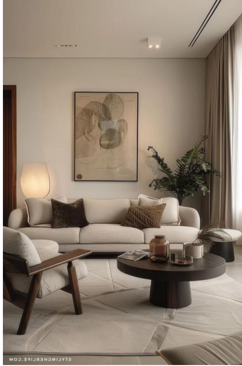
الشكل (١) نموذج التصميم الحديث.

النمط ليتناسب مع الأذواق الشخصية والاحتياجات الفردية، مما يجعله خياراً مرناً ومناسباً للكثيرين ومن العناصر الرئيسية للتصميم المعاصر في الديكور الداخلي: