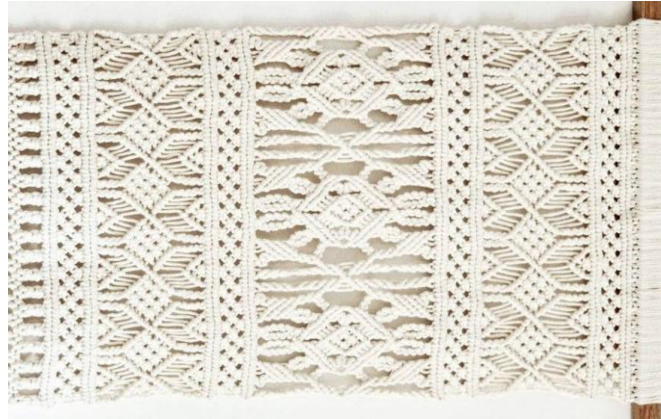
الشكل (٤) نموذج مكرمية