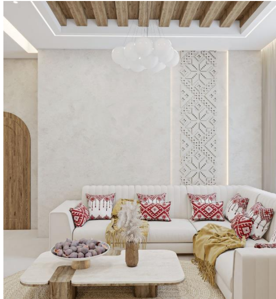
شكل (٦) غرفة معيشة.

كما يظهر في الشكل رقم (٦) غلب على الفراغات الداخلية البساطة يتخللها بعض التصاميم المأخوذة من محددات الهوية الفلسطينية مثل شكل التطريز على الجدار في وحدة التطريز (نجمة كنعان) الأكثر انتشاراً والأقدم بين وحدات التطريز الفلسطينية، وأضافت لمسات من وحدات التطريز في الوسائد مما يعزز الشعور بالهوية من خلال اختيار التطريز عليها في اللون الأحمر الذي يعد أشهر اللون التطريز الذي تشتهر فيه فلسطين ويعبر عن دماء الشهداء واللون العلم الفلسطيني، ونرى تلامساً كبيراً في الخامات المستخدمة من ناحية ألوانها أشكالها وطرق استخدامها كما في الصورة رقم (٦) كما أن الاثاث غلب عليه طابع الحداثة كما أن كانت العلاقة توافقية بين محددات الهوية الثقافية الفلسطينية والتصميم الحديث، كما نرى قدراً كبيراً من الاندماج و التوافق اللوني والمريح للنظر و الملائم لغرفة المعيشة.