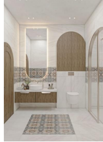
شكل (٢٠) الحمام

المصدر: تصميم الباحثة (November) نموذج تطبيقي على برنامج 3D MAX