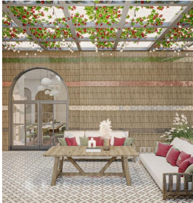
الشكل(١٥) الشرفة الخارجية

المعاني المستخدمة في تصميمها استخدام الوان العلم الموجودة على شكل التطريز الفلسطيني المدخلة بين ثنايا خشب البلوط و المرفق فيه الحديد و تواجد الخضرة بكثرة لاهتمام الفلسطينيين في الزراعة في كل وقت و حين , و العلاقة بين الورد و الحديد في سقف الترس واستخدام وردة المجنونة ( الجهنمية ) تحديدا التي تنتشر بكثرة في اسبانيا وفي الحدود الجانبية للترس, كما في الشكل(١٥) الحدود الجانبية للترس تم استخدام الحجر الفلسطيني المميز , الحدود الجانبية للترس تم استخدام الحجر الفلسطيني المميز كما في الصورة رقم(١٦).