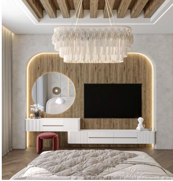
شكل(١٨) غرفة النوم الرئيسية

كما أستخدم خشب البلوط الذي يعتبر من محددات الهوية الثقافية الفلسطينية و السقف والارضية وفي كما في الشكل رقم(١٨).