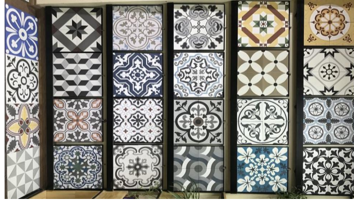
الشكل (٣) نموذج بلاط موزاييك.