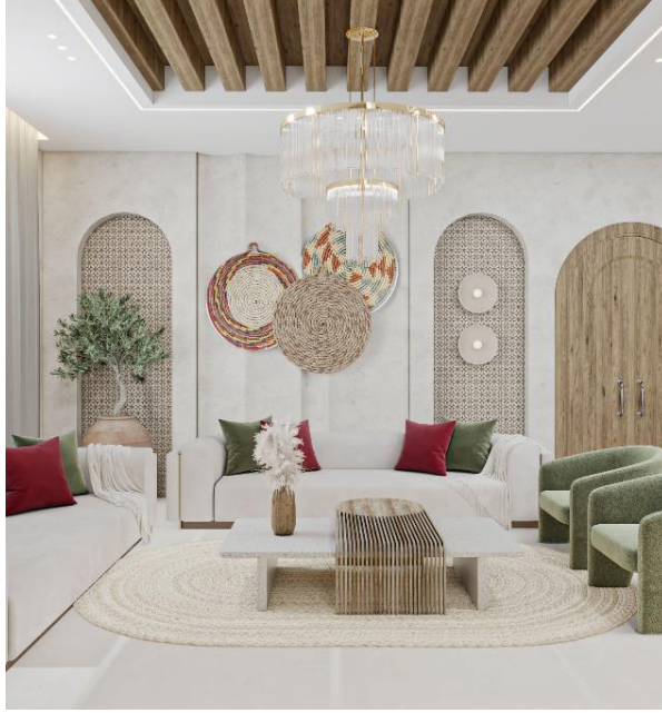
شكل (٨) غرفة الاستقبال.

المصدر: تصميم الباحثة (November) نموذج تطبيقي على برنامج 3D MAX