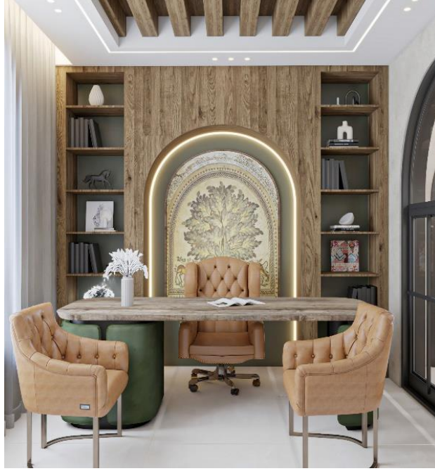
شكل (١٤) المكتب

المصدر: تصميم الباحثة (November) نموذج تطبيقي على برنامج 3D MAX