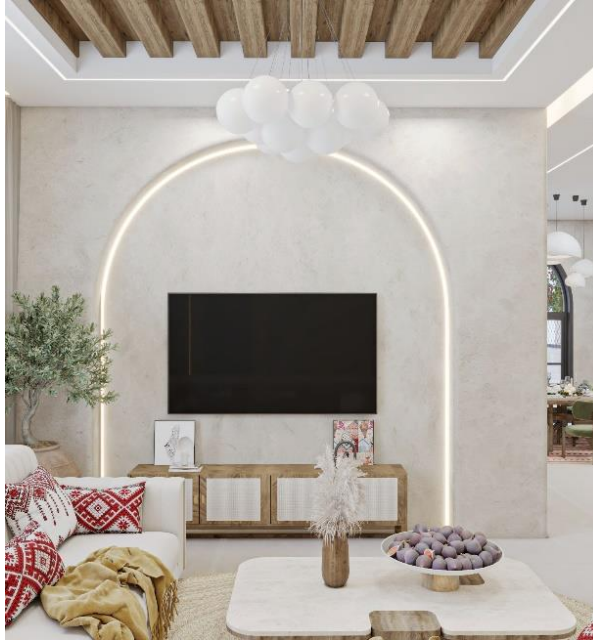
شكل (٥) غرفة معيشة

المصدر: تصميم الباحثة (November) نموذج تطبيقي على برنامج 3DMAX