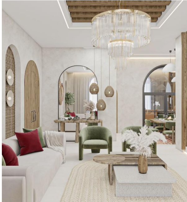
شكل (٩) غرفة الاستقبال

كما يظهر في الصورة رقم (٧)، : تضمن التصاميم المعتمدة على الاخشاب مثل خشب البلوط المستخدم في الابواب والزخارف في الاقواس والسقف منطقة الدرج وفي الجدران المحيطة بالدرج و الدمج بين الخشب و الموزيك حقت علاقة توافقية و ابراز جمال الدمج بينهما وتم استخدام خشب الزيتون في صناعة الطاولة الوسطية في غرفة المعيشة التي تعزز فكرة استخدام الزيتون في الاثاث، واستخدام الألوان الأخضر المستوحى من لون الزيتون و اللوان العلم الفلسطيني كما في الشكل رقم (٩).