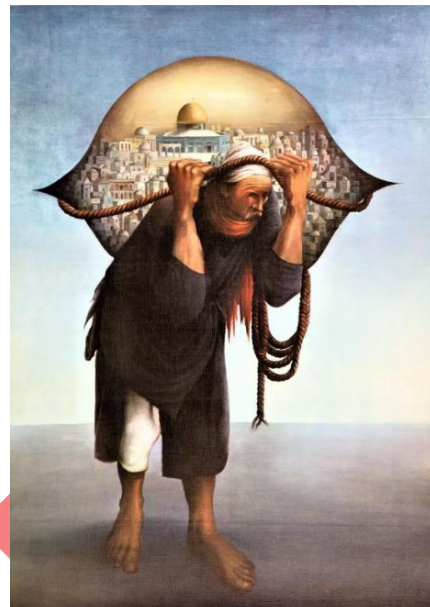
صورة (4): لوحة جمل المحامل بريشة سليمان منصور عام 1973 وتظهر بها القدس القديمة وقبة الصخرة كرموز للقضية الفلسطينية.

النكبة الفلسطينية وأثرها على تطور الرموز الوطنية: الحدث الأكبر والأخطر على الشعب الفلسطيني وهو النكبة الفلسطينية، التي تعني «كارثة» باللغة العربية، وتشير إلى الأحداث التي وقعت في فلسطين قبل وأثناء وبعد عام 1948، مما أدى إلى قيام إسرائيل وفقدان فلسطين (Seangthong, 2017). أدت النكبة إلى طرد معظم الشعب الفلسطيني من وطنه إلى البلدان المجاورة وحول العالم (Yaling, 2021).