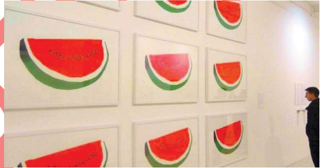
صورة (6): إحدى أعمال سلسلة لوحات "البطيخ الفلسطيني" للفنان خالد الحوراني عام 2013.

خلال حرب السابع من أكتوبر 2023 كان جلياً تركيز الفنانين الفلسطينيين ومن ينصرهم على استخدام الرموز الوطنية الفلسطينية حتى أنها أصبحت تستخدم في المظاهرات المؤيدة للشعب الفلسطيني والمعارضة لحرب الإبادة التي تشن ضده. فأصبح من المعتاد مشاهدة رموز مثل العلم والبطيخ وحظلة والكوفية الفلسطينية والمثلث الأحمر تجوب شوارع المدن في قارات العالم المختلفة وبذلك انتقل الرمز الذي بدأ به الفنانون إلى العالمية والامنشار الواسع ليصبح جزءاً من الصراع بين أنصار القضية الفلسطينية وأنصار الصهيونية ودولة الاحتلال.