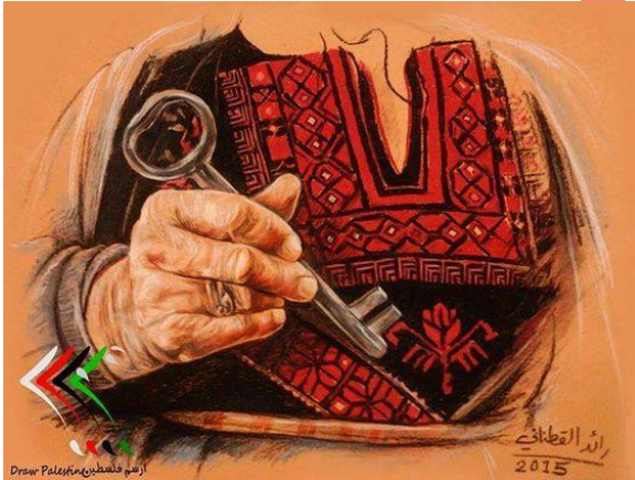
صورة (3): استخدام المفتاح والتطريز كرموز وطنية لوحة للفنان الفلسطيني رائد قطناني 2015.

المفتاح هو رمز قوي بشكل خاص في الفن الفلسطيني، يمثل حق العودة للاجئين الفلسطينيين والتوق إلى ديارهم وأراضيهم المفقودة.